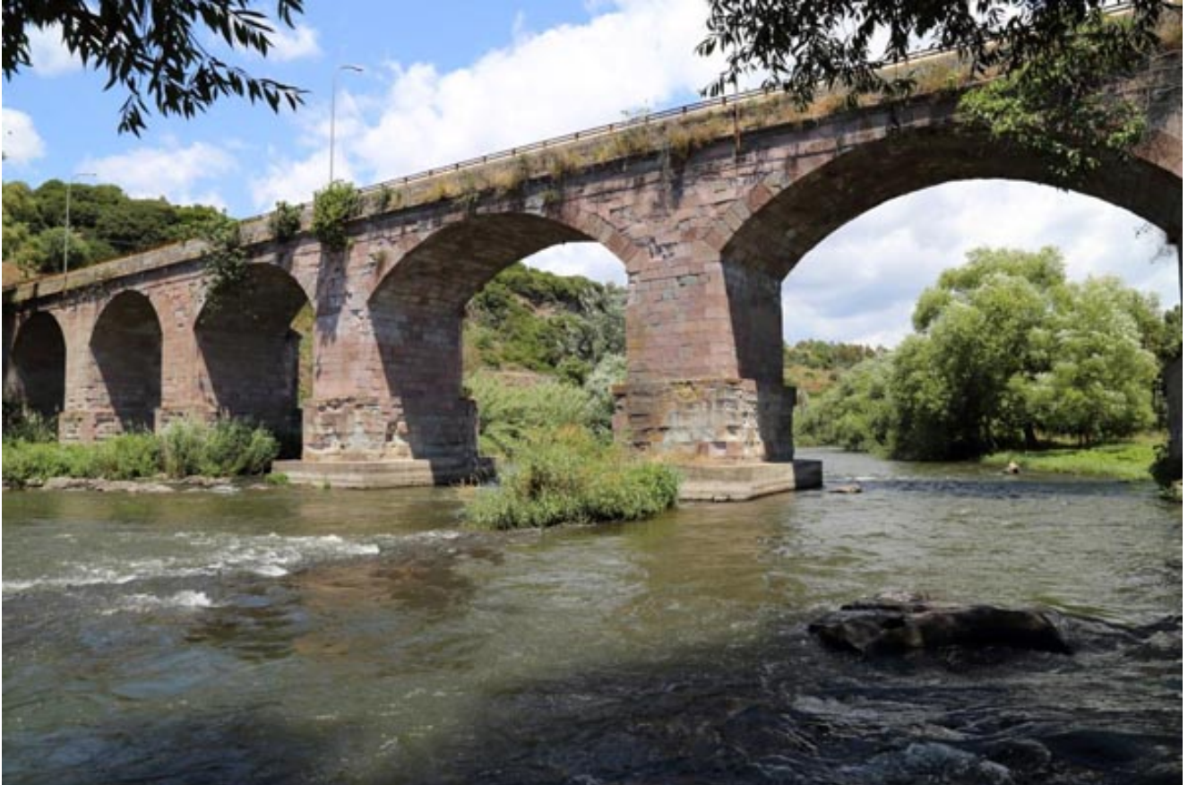
Abb. 4 - Brücke über den Tirso in Fordongianus: Die modernen Pfeiler ruhen auf dem Fundament der antiken römischen Brücke.

Im Fall der Brücke von Fordongianus (Abb. 4) wurde die Basis der Pfeiler aus opus quadratum ausgeführt, wie auch bei den Thermen I. Daher wird angenommen, dass der Bau der Brücke zeitgleich mit den Thermen während der städtebaulichen Neuordnung in der Trajanszeit erfolgte.