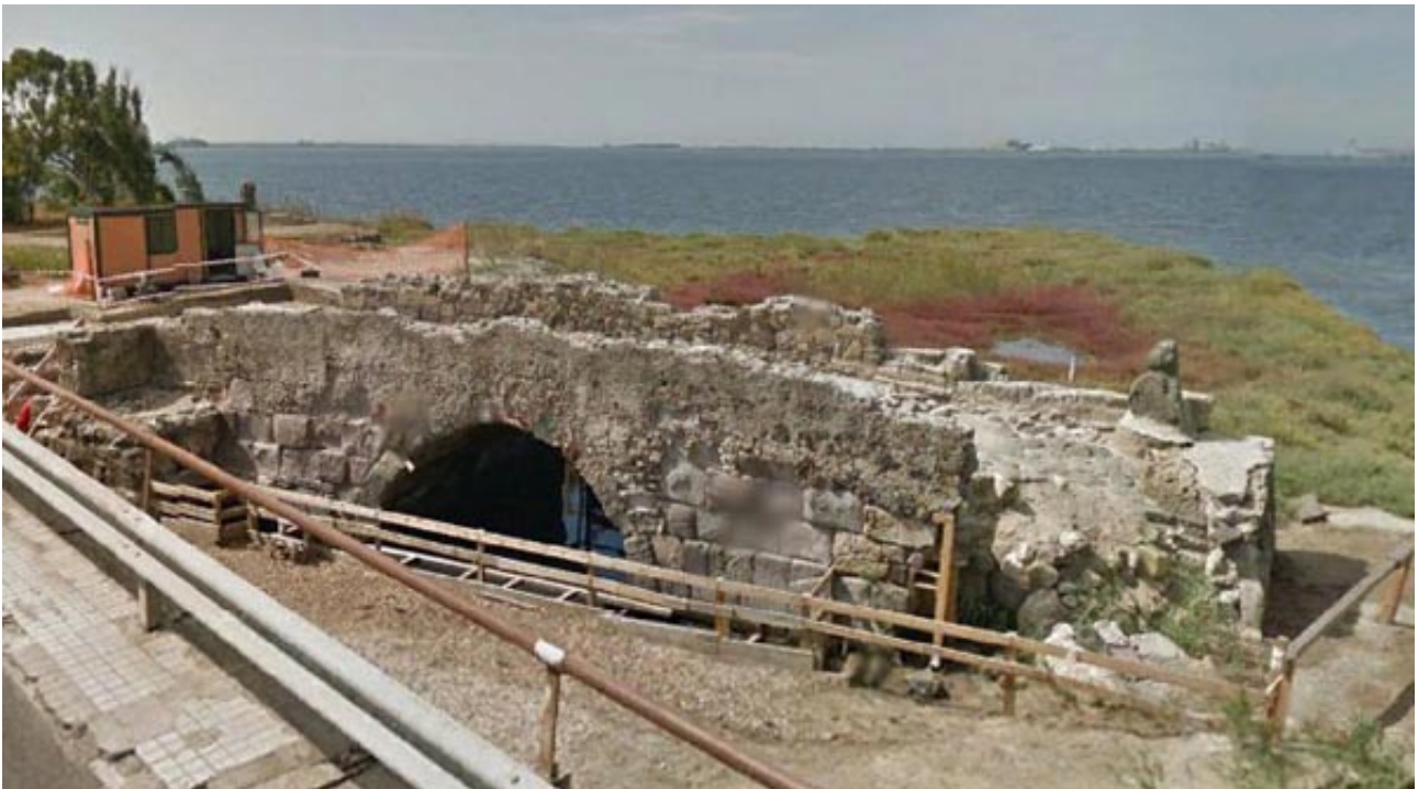
Abb. 1 - Überreste der römischen Brücke über den Tirso, auf der Höhe von Santa Giusta, dem antiken Ot-hoca

Zahlreiche Brücken überqueren Wasserläufe und viele davon sind mit kontinuierlichen Änderungen bis in die Moderne genutzt worden (Abb. 1-3); aus diesem Grund ist es schwierig zu verstehen, welche Strukturelemente aus der Römerzeit stammen.