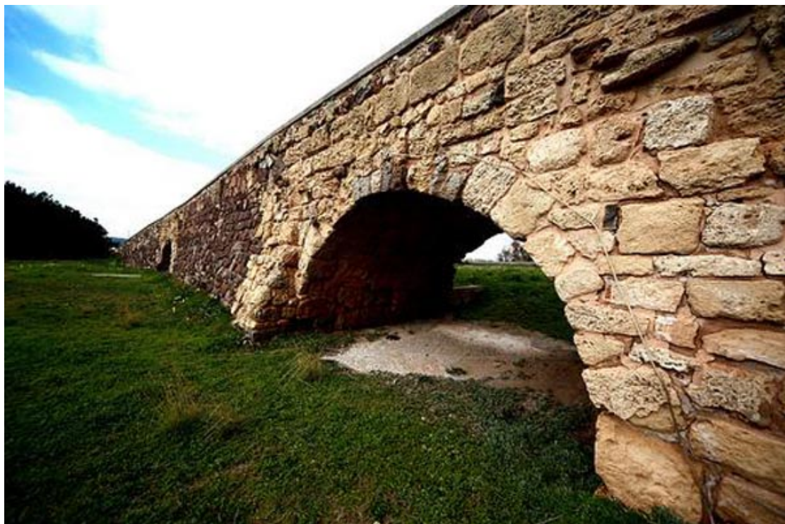
Abb. 3 - Sant'Antioco, Brücke, die auf den Überresten der römischen Brücke errichtet wurden