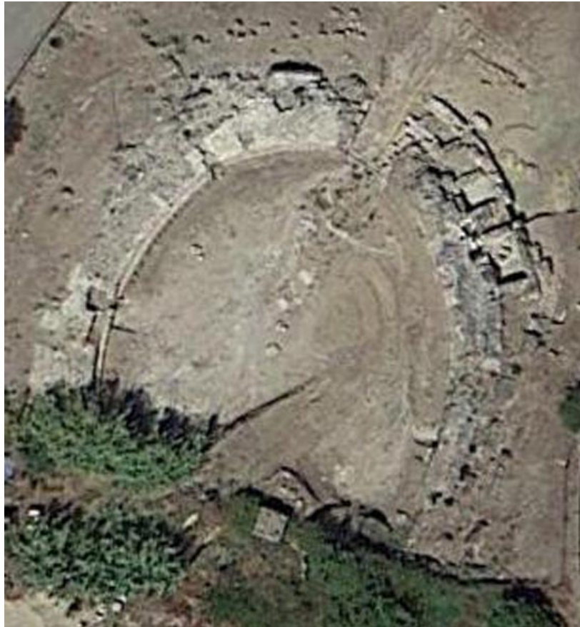
Abb. 1 - Bild des Amphitheaters von Fordongianus - ährend der Grabungsarbeiten.

Das Amphitheater von Forum Traiani befindet sich im kleinen Tal von Apprezzau, nahe des südlichen Rands der römischen Stadt (Abb. 1-2).