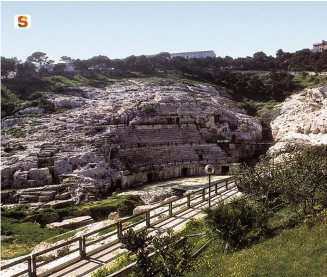
Abb. 3 - Das römische Amphitheater von Cagliari, auf einem Foto aus den 90er Jahren des vergangenen Jahrhunderts.

Erweiterung und Verschönerung bestand aus einer Galerie mit offenen Gängen an der ersten Fassade des Monuments sowie der Errichtung eines kleinen Sacaellums . In Sardinien sind wenige Amphitheater bekannt: Cagliari, Nora, Sant'Antioco, Tharros und Fordongianus. Die wichtigsten Überreste sind ohne jeden Zweifel die des großen Amphitheaters von Cagliari, das in den Fels des Buoncammino-Hügels geschlagen ist (Abb. 3-4).