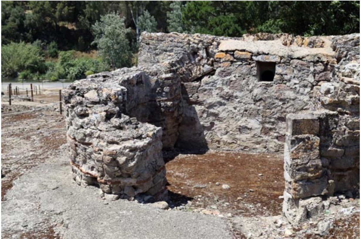
Abb. 3 - Ansicht des Gebäudes von Süden, mit Hervorhebung der Apsis