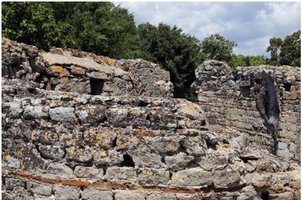
Abb. 4 - Detail der Bautechnik aus Opus Vittatum Mixtum