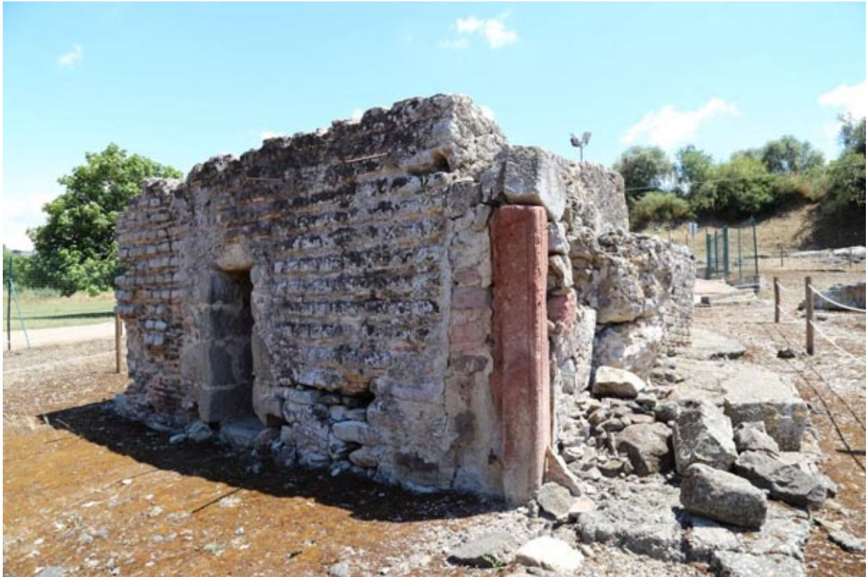
Abb. 2 - Das Gebäude, das als Nymphäum angesehen wird, wurde bis in die Moderne Umbauarbeiten unterzogen

Der Raum weist eine rechteckige Form mit einer kleinen Apsis auf (Abb. 3) und im Inneren befindet sich ein Becken.