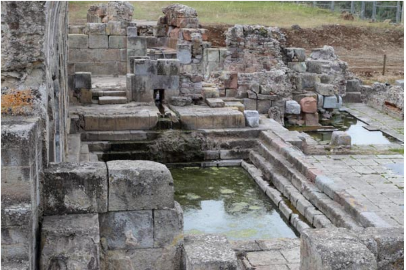
Abb. 4 - Das Natatium mit den Nebenräumen im Hintergrund.

Das Becken war wie der Portikus mit einem Tonnengewölbe überdacht und es ist nicht sicher, ob die Decke Öffnungen zur Beleuchtung aufwies. Dies ist jedoch aufgrund der Analogie mit besser erhaltenen Gebäuden sehr wahrscheinlich, auch wenn diese sich in anderen geographischen Gebieten befinden.