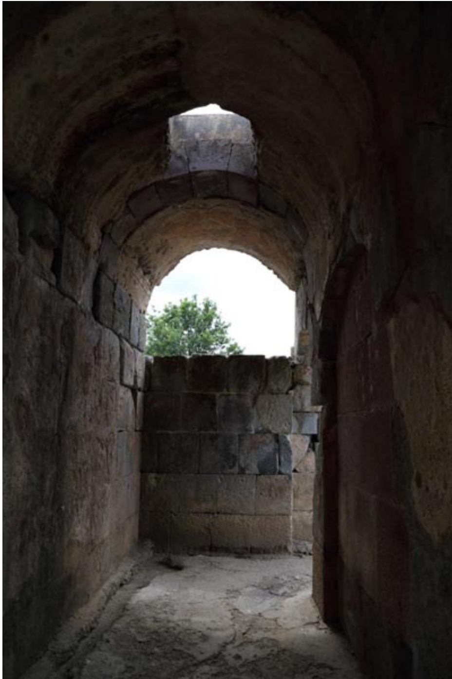
Abb. 3 - Das Innere des südlichen Portikusses.