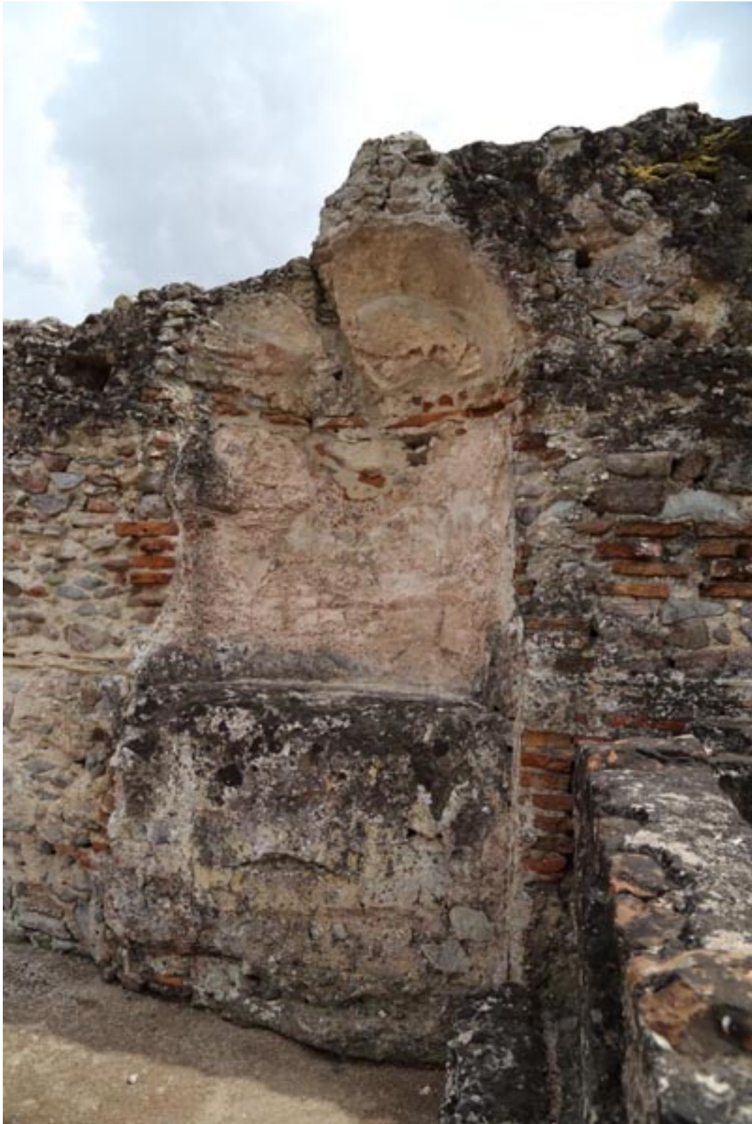
Abb. 5 - Die Nische neben dem Becken; in ihr befand sich eine ornamentale Statue.