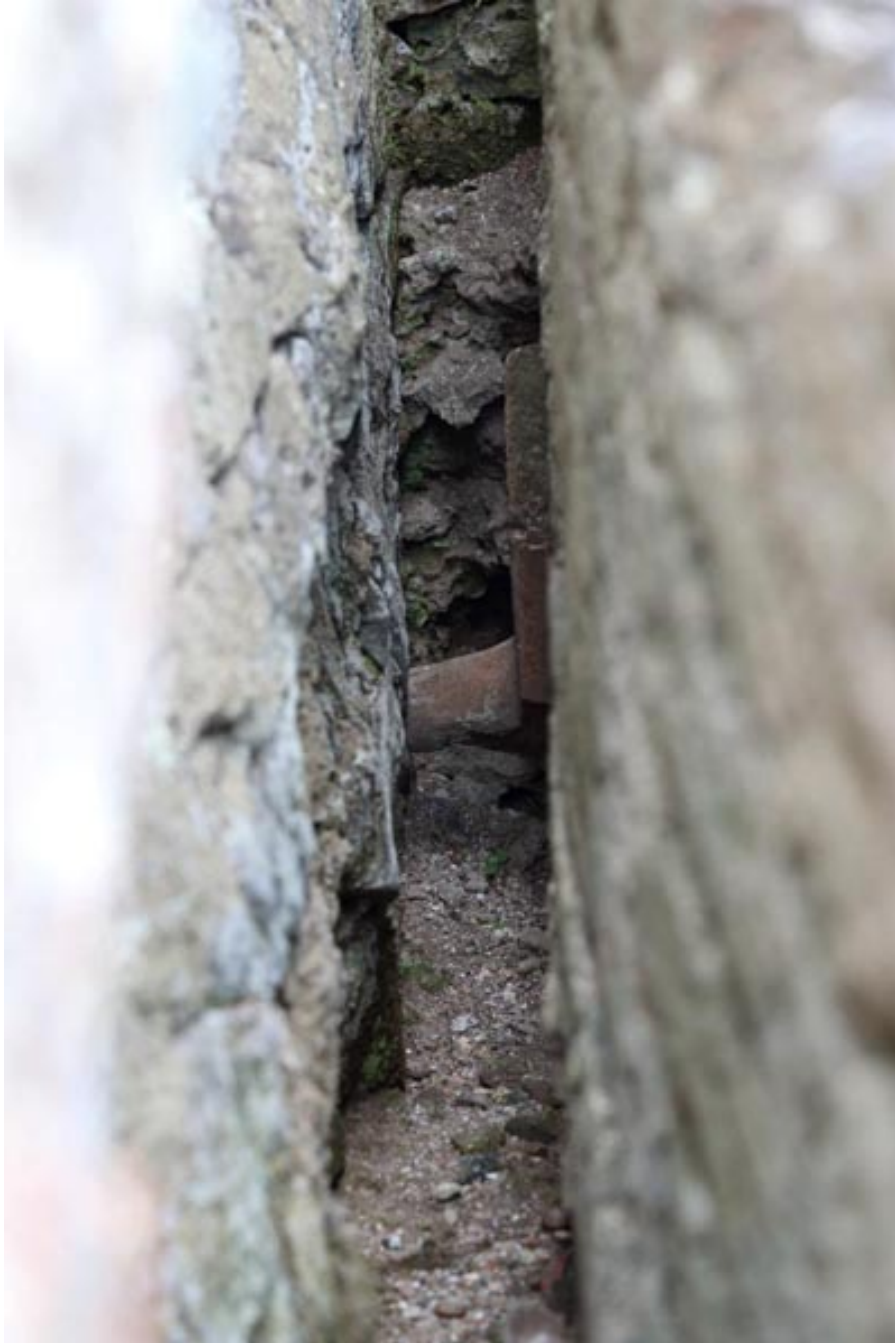
Abb. 3 - Detail des Zwischenraums zwischen dem Becken und der Wand, in dem die heiße Luft strömte.

In der Wand neben dem Becken befindet sich eine Nische, in der sich eine ornamentale Statue befand, die verlorengegangen ist (Abb. 4-5).