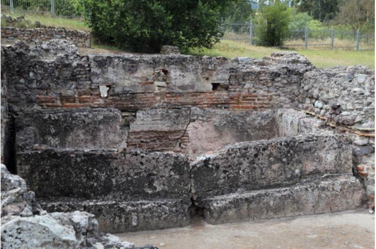
Abb. 2 - Becken des Kalidariums.

Das Kalidarium der Thermen von Fordongianus ist schlecht erhalten, es kann jedoch aufgrund des Vorhandenseins eines rechteckigen Beckens identifiziert werden (Abb. 2), in dem sich lauwarmes Wasser zur Erfrischung befand und an dessen Seite Überreste von Ziegel mit Hohlräumen zu erkennen sind (Abb. 3).