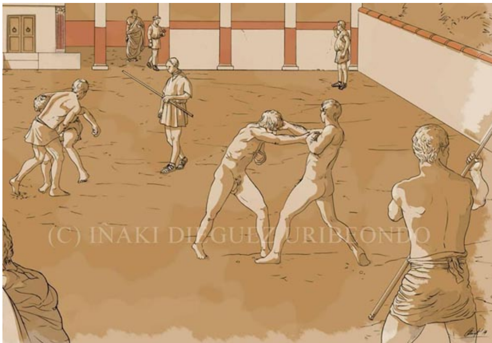
Abb. 4 - Rekonstruktion der Turnhalle der römischen Thermen von Sebastium , in der Nähe von Vitoria Gasteiz in Spanien (von Facebook " IDU. Ilustración y Dibujo arqueológico ", Illustration von Iñaki Diéguez Uribeondo).