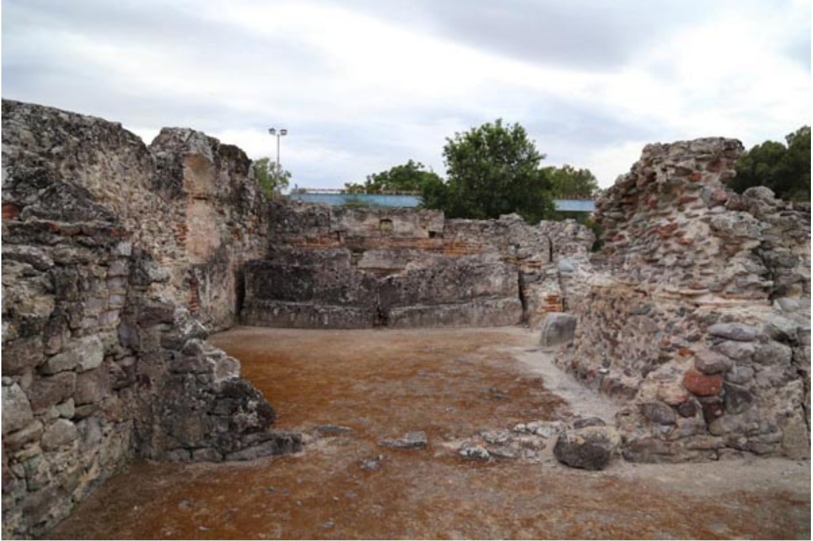
Abb. 3 - Durchgang vom Tepidarium zum Kaldarium.