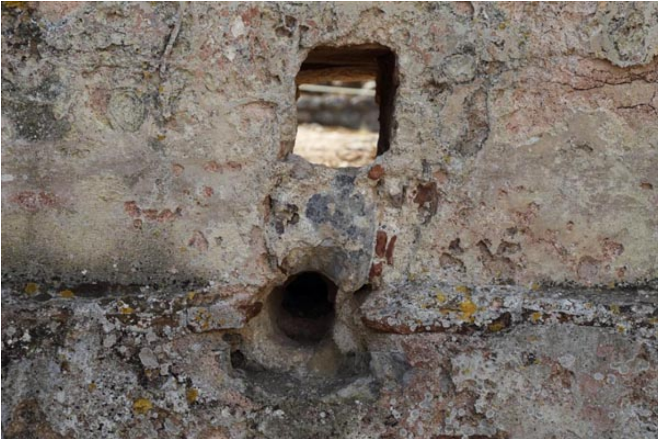
Abb. 5 - Detail der Löcher in der Mauer, durch die die Kanalisierungen für das Wasser führten.