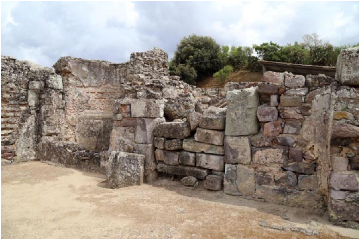
Abb. 2 - Eingang zum Frigidarium.

Das Frigidarium der Thermen von Fordongianus befindet sich in dem Bereich, der als Thermen II bezeichnet wird (Abb. 1, Raum I); es wurde in der zweiten Bauphase errichtet, wie auch der Eingangsbereich mit der großen Tür, die in spätantiker Zeit verschlossen wurde (Abb. 2). In dem Raum sind zwei Becken vorhanden, ein rechteckiges und ein halbrundes (Abb. 2-4), beiden mit bescheidenen Abmessungen.